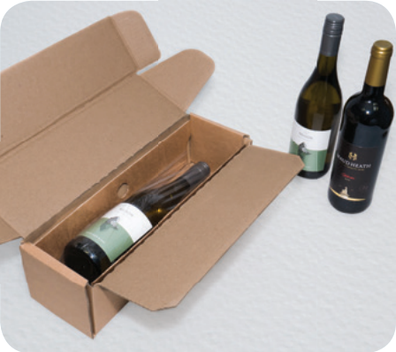
KS-RP-07 Regular e KS-RP-07 Box 1