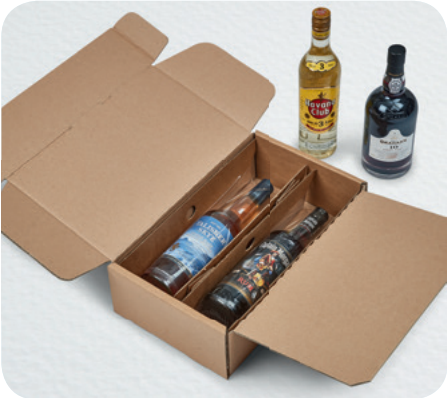
KS-RP-07 Regular e KS-RP-07 Box 2