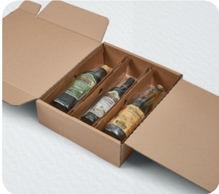
KS-RP-07 Regular e KS-RP-07 Box 3